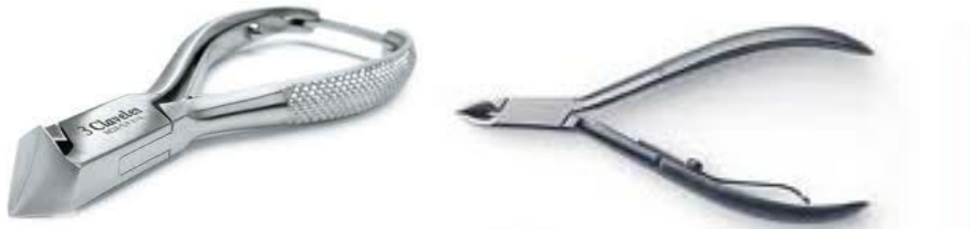
A) ALICATES DE UÑAS Y B) ALICATES DE PIELES

2.4 PULIDORES: Se utilizan para reavivar el brillo natural de las uñas su forma es similar a la lima se diferencia de esta por la textura de sus superficies